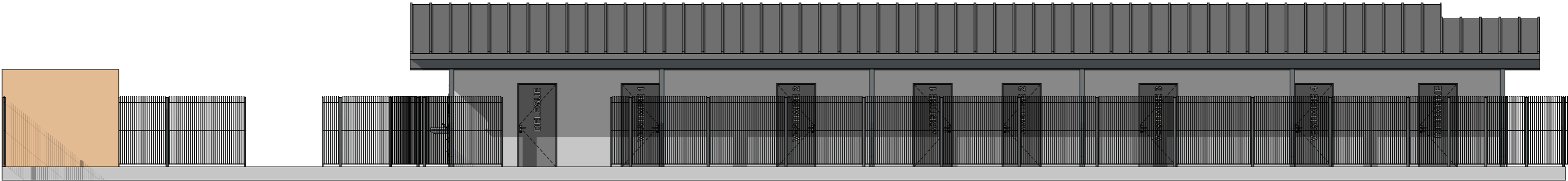
SUD Façade SUD 1:100